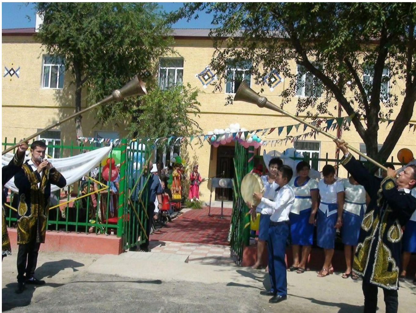
Открытие нового многоквартирного дома для женщин в трудной ситуации в Кунградском районе.

К концу 2018 года в Каракалпакстане 131 женщина, попавшая в трудную жизненную ситуацию, получила жилье.